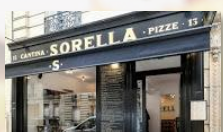
Sorella Paris 16

« Le service dans les crêperies, ça doit aller très vite et j'ai des clients exigeants. Avec Billee je tiens cette promesse même pour les plus pressés et en plus j'en accueille davantage ! Il nous le faut pour Odéon ! »